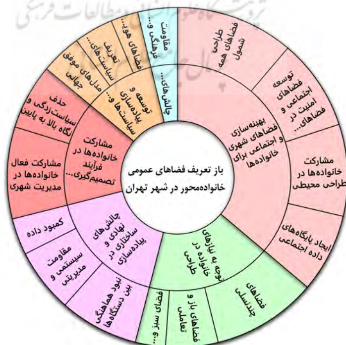
شکل ۳. نمودار درصد مشارکت مقوله‌ها و زیرمقوله‌ها در فضاهای عمومی دوستدار خانواده براساس کدگذاری

در نهایت، توسعه و پیاده‌سازی سیاست‌ها و دستورالعمل‌های خانواده‌محور به‌عنوان گامی عملی در جهت اجرای طرح‌های خانواده‌محور مطرح شد. پیشنهادها برای ایجاد فضاهای جدید با هویت خانواده‌محور و بهره‌گیری از مدل‌های موفق جهانی از جمله مهم‌ترین نکته‌های مطرح‌شده در این بخش بودند. در مجموع، یافته‌ها نشان می‌دهند که فضاهای عمومی دوستدار خانواده باید به‌گونه‌ای طراحی شوند که نیازهای مختلف این گروه اجتماعی را در نظر بگیرند. این نیازها شامل مشارکت فعال خانواده‌ها در فرایندهای شهری، رفع موانع نهادی و ساختاری و توجه به ابعاد اجتماعی و فرهنگی خاص خانواده‌هاست. این پژوهش بر لزوم ایجاد فضاهای عمومی چندنسلی، امنیت در فضاهای عمومی و مشارکت خانواده‌ها در تصمیم‌گیری‌های شهری تأکید دارد و نشان می‌دهد که برای پیاده‌سازی مؤثر فضاهای خانواده‌محور، نیاز به همکاری بین نهادهای مختلف، جمع‌آوری داده‌های دقیق و به‌روز و آموزش مدیران شهری برای تغییر نگرش‌ها ضروری است.