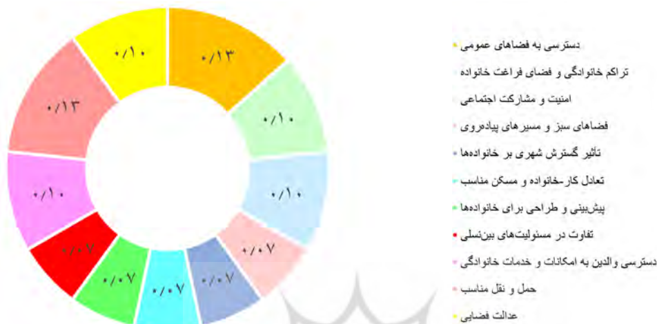
شکل ۲. تحلیل تطبیقی عبارات کلیدی در پژوهش‌های داخلی و جهانی پیرامون فضاهای عمومی خانواده‌محور

کار-خانواده وجود دارد که به‌ویژه در مقیاس‌های کلان‌شهری و سیاست‌گذاری‌های شهری اهمیت پیدا می‌کند. این نتایج نشان‌دهنده نیاز به طراحی فضاهای عمومی مناسب و پاسخ‌گو به نیازهای خانواده‌هاست؛ به‌ویژه در شهرهای در حال رشد که چالش‌های جدیدی را برای تعاملات خانوادگی ایجاد می‌کنند (شکل ۲).