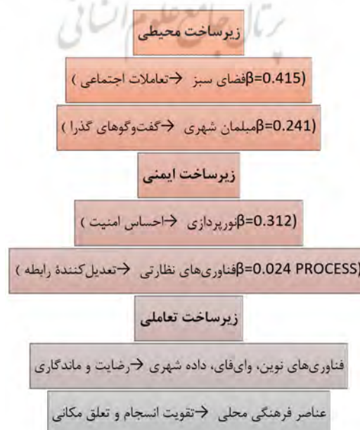
نمودار ۴. مدل سه‌لایه اثرگذاری طراحی و فناوری

مدل نهایی با ترکیب یافته‌های کمی و کیفی در قالب سه لایه اثرگذاری طراحی شهری در منطقه ۱۰ تهران.