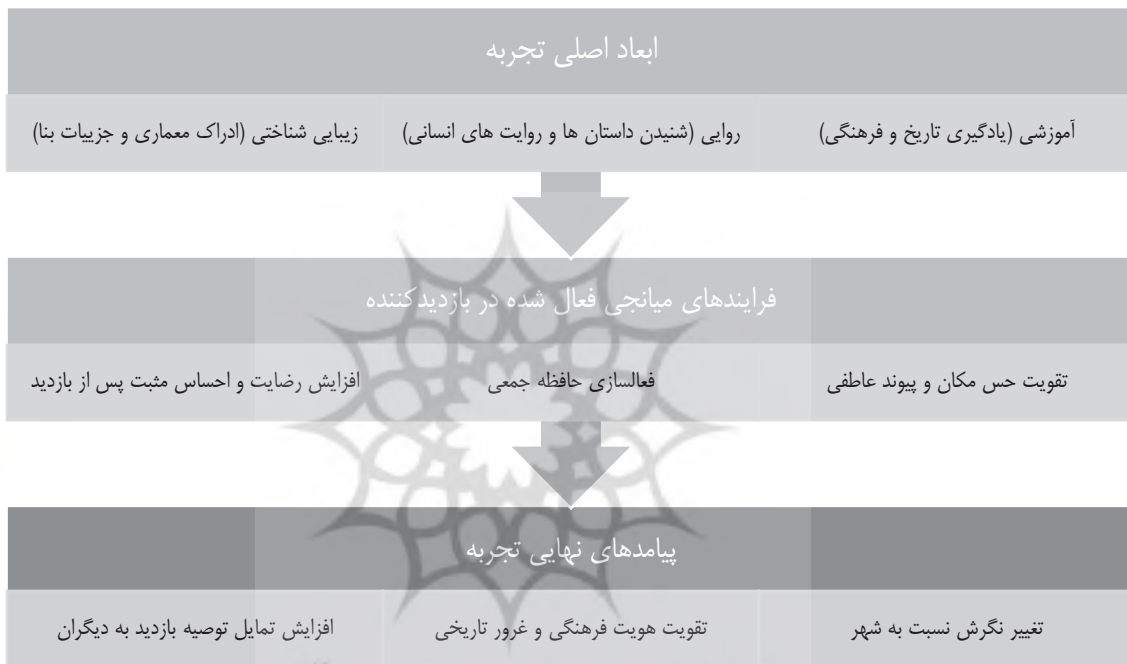
شکل ۲. مدل یکپارچه یافته‌ها

پژوهش حاضر با رویکردی ترکیبی (کمی کیفی) به بررسی تأثیر بازدید از خانه‌ها و عمارت‌های تاریخی بر نگاه و اندیشه بازدیدکنندگان نسبت به شهر تهران پرداخت. این بخش مقاله به تفسیر یکپارچه یافته‌ها، پیوند آن‌ها با ادبیات نظری، ارائه پیامدهای کاربردی و ترسیم مسیر پژوهش‌های آتی اختصاص دارد. براساس نتایج کمی و کیفی پژوهش، مدل تلفیقی زیر به‌عنوان چهارچوب نهایی در تبیین تجربه بازدید از خانه‌های تاریخی تهران ارائه می‌شود. نمودار زیر مدل نهایی پژوهش را به تصویر می‌کشد و ساختار ارتباطی میان ابعاد، فرایندها و پیامدها را به‌صورت یکپارچه نمایش می‌دهد. لازم به یادآوری است که این مدل، نسخه تکامل یافته چهارچوب مفهومی اولیه پژوهش است که اکنون براساس داده‌های تجربی اصلاح و تأیید شده است.