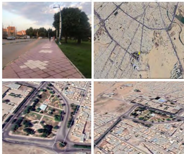
شکل ۳. موقعیت پارک کاردانش بهبهان

پارک کاردانش بهبهان که به نام «بوستان دانشجو» نیز شناخته می‌شود، یکی از پارک‌های محبوب و پرتردد در شهر بهبهان، استان خوزستان است. این پارک در بلوار شهید شعبانی و میدان تربیت‌معلم واقع شده است. به دلیل موقعیت مرکزی و دسترسی آسان، خانواده‌ها، دانشجویان و گردشگران به آن توجه ویژه‌ای دارند. این پارک با مساحت حدود ۵۰۰ متر مربع، فضای مناسبی برای تفریح و استراحت فراهم کرده است. قرارگیری آن در نزدیکی مراکز آموزشی مانند هنرستان‌ها و دانشگاه‌ها، این پارک را به مکانی مناسب برای دانشجویان و دانش‌آموزان تبدیل کرده است. در اطراف پارک، رستوران‌ها و فست‌فودهای متعددی مانند رستوران ریحون، رستوران گل، رستوران ایتالیایی ژینو، پیتزا آفتاب، رستوران ایتالیایی آلفردو و رستوران و بیرون‌بر پروازه قرار دارند که گزینه‌های متنوعی برای بازدیدکنندگان فراهم می‌کنند. پارک کاردانش یا بوستان دانشجو بهبهان، با فضای سبز دل‌نشین، امکانات رفاهی مناسب و موقعیت مکانی مطلوب، یکی از بهترین گزینه‌ها برای گذراندن اوقات فراغت در این شهر است. تلاش‌های شهرداری برای توسعه امکانات این پارک، نشان‌دهنده اهمیت آن در زندگی اجتماعی و فرهنگی شهروندان بهبهان است.