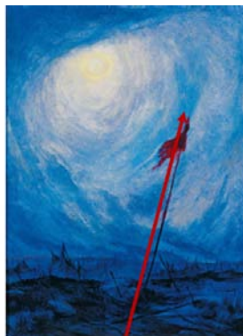
تصویر ۶. ترکیب‌بندی عمودی در اثر «نور عاشورایی» (نگارندگان، ۱۴۰۳)