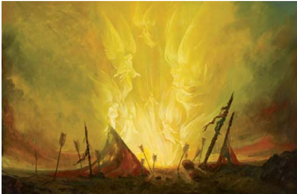
تصویر ۱. نام اثر: والفجر، ۱۳۹۴ (URL2)