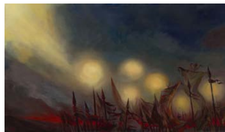
تصویر ۳. نام اثر: آیه عجب (قدیریان، ۱۳۹۶: ۸۷)

یکی از وقایع شگفت انگیز پس از عاشورا، بنا بر گزارش های معتبر تاریخی از علمای شیعه و سنی که نقل و مطمح نظر واقع شده است، قرآن خواندن سر مطهر امام حسین (ع) بر سر نیزه بود که به نوعی انتساب شهادت با تلاوت، انس امام حسین (ع) با قرآن و ارتباط نور با نور را بازگو می کند. از جمله آیاتی که با رویداد عاشورا تطبیق شده است، آیات مربوط به اصحاب کهف است که سر مبارک سیدالشهدا (ع) این آیه را تلاوت فرموده اند و حکایت از این است که سوره کهف به نوعی با امام حسین (ع) مرتبط است. در تصویر ۳، ظلمات دنیا و نورانیت عالم معنا نمایان شده است. «أَمْ حَسِبْتَ أَنَّ أَصْحَابَ الْكَهْفِ وَالرَّقِيمِ كَانُوا مِنْ آيَاتِنَا عَجَبًا: آیا پنداشته ای که اصحاب کهف و رقیم از نشانه های ما در مقابل این همه آثار قدرت ما چیزی شگفت بوده اند؟» (کهف / ۹). «عالم دنیا بدون کاروانیان امام حسین (ع)، تاریک تر و زشت تر شده بود؛ اما بر روی نیزه ها، ماجرای عجیبی در جریان است. انگار همراه با حرکت کاروان اسرا و شهدا، حرکتی دیگر هم در کار بود. در عالمی دیگر، کهکشان نیزه ها با پرتوهای نوری زیبا و بی اعتنا به تاریکی ها و آلودگی ها به سوی مأمن و کهفی نورانی و منبع نورانیت می رفتند» (قدیریان، ۱۴۰۳).