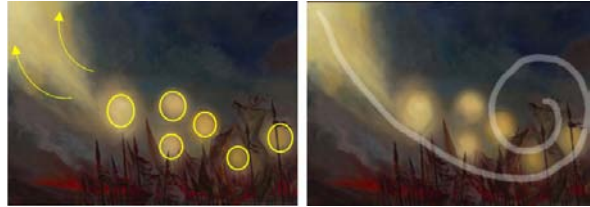
تصویر ۴. ترکیب‌بندی حلزونی در اثر «آیهٔ عجیب» (نگارندگان، ۱۴۰۳)

را تکرار می‌کند. رنگ‌هایی چون زرد، آبی تیره و قرمز، عناصر رنگی مسلط در اثر نیز هستند.