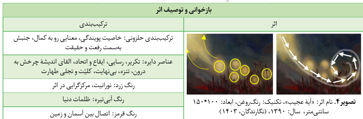
جدول ۳. خلاصه بازخوانی و توصیف اثر «آیه عجب» (نگارندگان، ۱۴۰۳)

تصویر ۴. نام اثر: «آیه عجب»، تکنیک: رنگ‌روغن، ابعاد: ۱۵۰*۱۰۰ سانتی‌متر، سال: ۱۳۹۰، (نگارندگان، ۱۴۰۳)