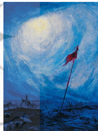
تصویر ۵. نام اثر: نور عاشورایی، تکنیک: رنگ روغن، ابعاد ۷۰*۱۰۰ سانتی‌متر، ۱۳۸۹ (قدیریان: ۱۳۹۶: ۸۶)

قدیریان در مورد خلق اثر می‌گویند این نقاشی را بعد از خواندن حدیثی درباره لوح محفوظ کشیده است. در عالم شهود و لوح محفوظ، اولین کلامی که نوشته شد، شهادت حسین بن علی (ع) بوده است. این حدیث برای قدیریان حاکی از این بود «که همه چیز بر مدار امام حسین (ع) می‌گردد و یک نوع جوشش و کشش در مرکزیت عالم با نام امام حسین (ع) با این کلام ایجاد می‌شود» (قدیریان، ۱۴۰۳).