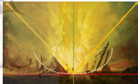
تصویر ۲. ترکیب‌بندی افقی و شعاعی در اثر «والفجر» (نگارندگان، ۱۴۰۳)

در قسمت پایین تصویر، عنصر موجود شاهد حادثه، زمین است. بر اساس مراتب جهان‌شناسی اشراقی، عوالم به چهار قسمت تقسیم‌بندی می‌شوند که هر کدام دارای مرتبه‌ای هستند. پایین‌ترین عالم در نظریه شیخ اشراق، عالم عناصر و محسوسات است که برازخ افلاک با ستارگانی که در آن قرار دارند را شامل می‌شود (Corbin, 2005:224). سهروردی به عالم ماده و طبیعت اشاره می‌کند و زمین را رمزی قرار می‌دهد برای تاریکی این عالم. شیخ در رساله خود از طریق اسامی‌ای مانند مزرعه (زمین) و چاه سیاه، به عالم خاکی و ماده اشاره می‌کند (الیاسی و اخلاقی، ۱۴۰۰: ۲۰۹). بدین شرح، در این اثر خشکی و فرسودگی زمین، نماد عالم ماده، عالم کون و فساد، عالم برهوت و فانی، ترسیم شده و نوعی سنگینی را به بیننده القا می‌کند. تیرهای اصابت‌شده، همگی سمعی دایره‌وار بر محور واقعه دارند که امام است و غایب و خطوط آشفته و تیرهای به‌جامانده، خستگی مفرط و زجری را که متحمل شده، بروز داده است.