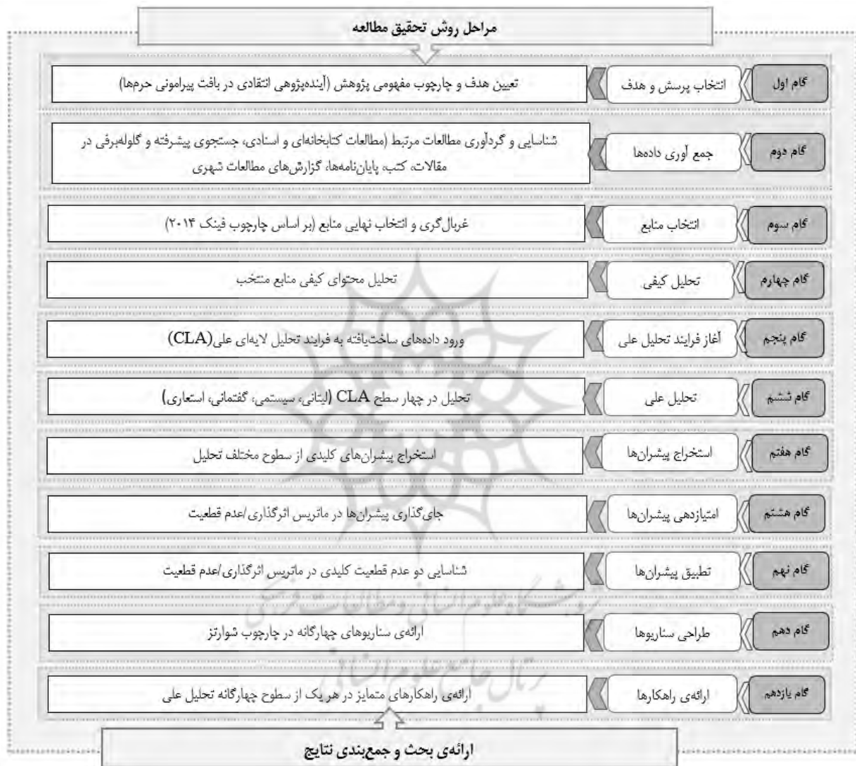
شکل ۱. فرایند روش انجام تحقیق