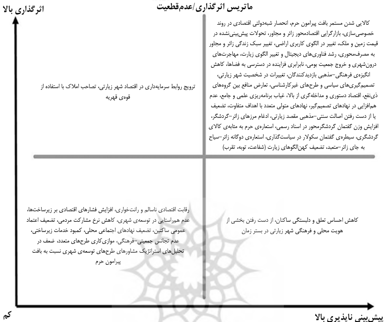
شکل ۳. ماتریس اثرگذاری-عدم قطعیت در تحقیق حاضر