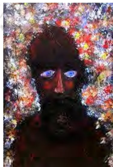
تصویر ۹. ترکیب مواد روی کاغذ. مأخذ: https://www.artmajeur.com/bachi-jincharadze/en/artworks/14007935/fana-mansur-al-hallaj