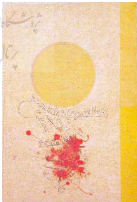
تصویر ۳. آکیاواش، حلاج، ۱۹۸۹، ۷۰ در ۹۲ سانتی‌متر، اکریلیک روی کاغذ دست‌ساز هندی.

صرف از عرفان ایرانی- اسلامی در عرصه هنر مدرن نیست؛ بلکه تجلی درونی‌ترین لایه‌های روح یک هنرمند است که تا با الوهیت خویش ارتباط برقرار نکند قادر به خلق آن نخواهد بود و مانا نخواهد شد. در تحلیل بصری، کادر اثر مربع‌شکل است؛ مربع، در هندسه معنوی، نشانه ثبات، تعادل، ساختار، کمال و حضور است که در آثار معماری و خوش‌نویسی اسلامی حضوری بنیادین دارد. رنگ آبی زمینه و ضربات آزاد و درهم قلم‌مو، تصویرگر خروشان‌ی رود، پاکی و بی‌نهایتی است. این آبی را می‌توان تجلی رود دجله دانست که هم جغرافیای تاریخی شهادت حلاج است و هم استعاره‌ای از سیر جاری روح انسان به سوی حق. جمله اناالحق، این عبارت طنین‌افکن، فریاد آتشین حلاج در برابر حقیقت است که به رنگ قرمز، در مرکز اثر، نه با نوشتاری عادی، بلکه به‌گونه‌ای معکوس است. این معکوس‌نویسی، تنها یک بازی بصری نیست؛ بلکه تأمل‌برانگیزترین وجه تفسیری اثر است. جمله یا حروف در آینه، معکوس خوانده می‌شوند. اینجا آینه استعاره از ضمیر چه کسی است؟ ضمیر هنرمند که حقیقت را