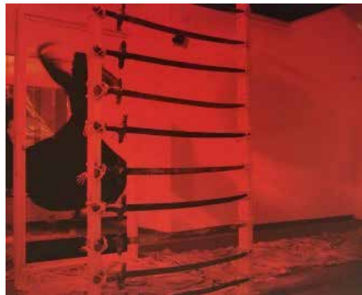
تصویر ۷. ویدئو آرت.

۳. «مَنْ طَلَبَنِي وَجَدَنِي، وَ مَنْ وَجَدَنِي عَرَفَنِي، وَ مَنْ عَرَفَنِي أَحْبَبَنِي، وَ مَنْ أَحْبَبَنِي عَشَقَنِي، وَ مَنْ عَشَقَنِي عَشِقْتُهُ، وَ مَنْ عَشِقْتُهُ قَتَلْتُهُ، وَ مَنْ قَتَلْتُهُ فَعَلِيَ دَيْتَهُ، وَ مَنْ عَلِيَ دَيْتَهُ فَأَنَا دَيْتُهُ» هرکه مرا جوید یابد و هرکه مرا یافت، بشناسد و هرکه مرا شناخت، دوست دارد و هرکه مرا دوست بدارد عاشقم گردد و هرکه عاشقم