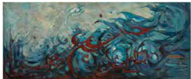
تصویر ۶. حسینی، یاد یک حماسه، ۱۳۶۹، ۸۰ در ۱۹۰، رنگ‌روغن روی بوم.