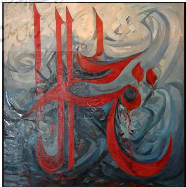
تصویر ۵. حسینی، أنال‌الحق، ۱۳۵۷، رنگ‌روغن روی بوم. مأخذ: دلزنده، ۱۳۹۵، ۳۴۲.

«یاد یک حماسه» (تصویر ۶) بیانی تصویری از حقیقتی چندلایه و ساحت‌مند است که از خلال زبان بصری انتزاعی، مخاطب را به تأملی عمیق در باب شهادت،