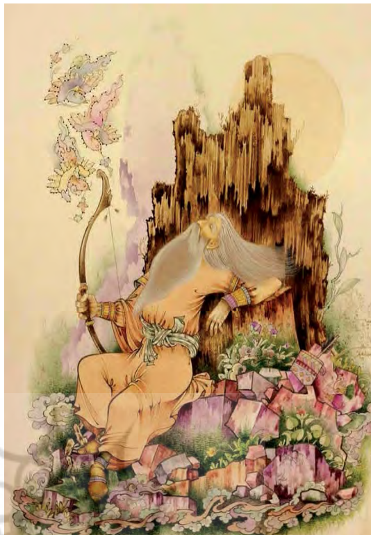
تصویر ۱. دو نمونه از آثار نگارگری اردشیر مجرد تاکستانی (اردشیر مجرد تاکستانی، نمونه آثار نگارگری هنرمند، [عکس شخصی از مجموعه شخصی]، ارتباط شخصی، ۱۴ مهر، ۱۴۰۳)