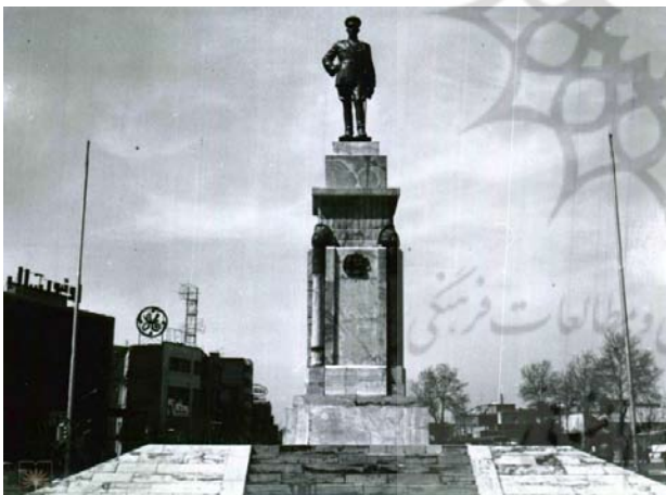
تصویر ۲. میدان ۲۴ اسفند تهران. مأخذ: سازمان اسناد و کتابخانه ملی ایران، شماره سند: ۱۲۸۹/۲۵/۹۹۸.

جهت‌گیری مرکز-پیرامون: همان‌طور که در دوره پهلوی، قدرت از