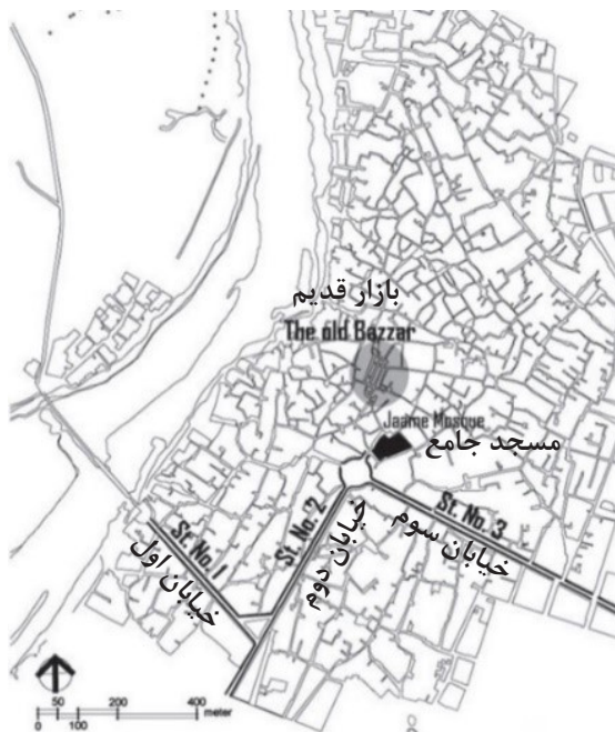
تصویر ۱. نخستین خیابان‌ها و میادین مدرن و محل مسجد جامع و بازار قدیمی شهر دزفول.

در سطح نخست، این امر از طریق ترکیب یک نام یادبودی و یک مجسمه مرتبط با آن انجام می‌شد. میدان رضا شاه و لایه‌های جدید معنایی‌اش از این پس تبدیل به یک سیستم نشانه‌شناختی می‌شد. در سطح بعدی، این سیستم نشانه‌شناختی از طریق ارتباط بینامتنی با محیط پیرامونی‌اش به گفتگو می‌پرداخت. این گفتگومندی باعث می‌شد کلیت میدان در خدمت پیام‌های مورد نظر حاکمیت قرار بگیرد. این گفتگومندی از سویی در تقابل با بافت سنتی پیرامونی قرار گرفته و به انکار آن می‌پرداخت. از سویی دیگر با بخش‌هایی از شهر-متن جدید هم‌صدا می‌شد و نسخه‌ای گزینشی از تاریخ را در راستای تثبیت هژمونی فرهنگی پادشاهی پهلوی تقویت می‌کرد. ۱