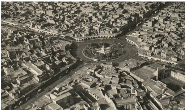
تصویر ۳. جهت‌گیری مرکز، پیرامون در میدان رضا شاه.