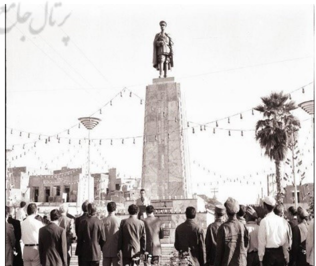
تصویر ۴. پرسپکتیو پایین به بالای میدان و مجسمه رضا شاه.

رضا شاه تا پایان عمر به راه و رسم نظامی تعهد ویژه‌ای داشت. فریدون جم که در دوران تبعید در جزیره موریس همراه وی بود، به یاد می‌آورد که وقتی رضا شاه در ضیافت فرماندار جزیره مجبور به پوشیدن لباسی غیر از لباس مشهور نظامی‌اش شده بود،