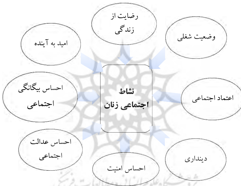
شکل ۱. مدل نظری پژوهش

بر اساس اهداف پژوهش و با استفاده از چارچوب نظری، مدل نظری پژوهش عبارت است از: