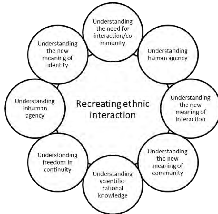
Figure 1- Thematic map of recreating ethnic interaction

freedom in continuity, 7) Understanding inhuman agency, and 8) Understanding the new meaning of identity. Figure (1) illustrates the thematic map of these main clusters of "Recreating ethnic interaction."