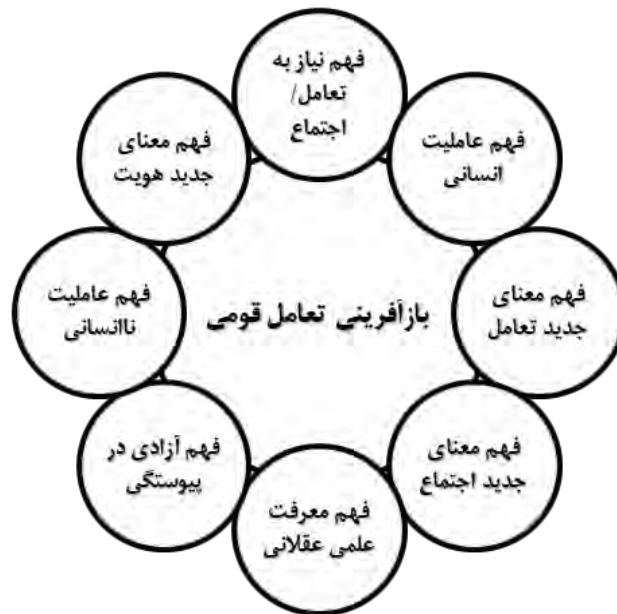
شکل ۱- نقشه تماتیک بازآفرینی تعامل قومی

همان‌طور که از ساختار سلسله‌مراتبی تحلیل مشاهده می‌گردد «بازآفرینی تعامل قومی» مفهومی برخاسته از یکسان‌سازی افق‌های فکری مصاحبه‌های عمیق می‌باشد که «معنای تجربه‌زیسته» را کنکاش کرده است. به عبارت دیگر این مفهوم که شامل ۸ خوشه اصلی می‌باشد، نشانگر معنایی است که کنشگران در آگاهی‌شان از دگرگونی تعاملات قومی بر اثر مواجهه با مخاطره کووید-۱۹ دارند. شکل (۱) نقشه تماتیک خوشه‌های اصلی «بازآفرینی تعامل قومی» را نشان می‌دهد.