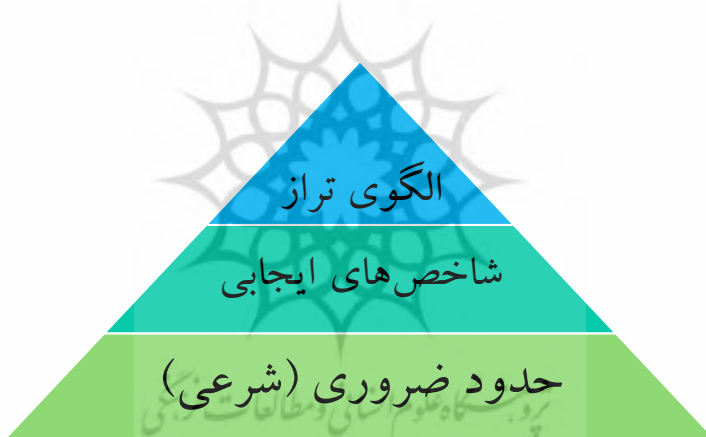
شکل شماره ۳: الگوی اوقات فراغت در اسلام

مختلف اخلاقی، تربیتی، فرهنگی، علمی و فیزیولوژیکی مطرح می‌شود و موجب تعالی و ارتقای کیفی سطح بهره‌مندی فرد و جامعه از اوقات فراغت می‌شود. ۳. الگوی تراز: مؤلفه‌های ایده‌آل گذران اوقات فراغت که برای همگان قابل اجرا نیست. اجرای برخی حدود همچون پرهیز از لغو، مولد بودن، فعالانه و آموزنده بودن و فرهنگ‌سازی لذات عمیق برای افراد مستعد و ممتاز تجویز شده و الزام این قیود برای عموم جامعه مطلوب نیست و می‌تواند پیامدهای غیر مطلوبی به همراه آورد.