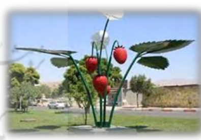
شکل (۳) المان توت‌فرنگی در شهر سنندج