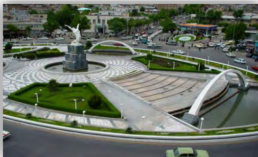
عکس شماره ۱: میدان آزادی سنندج

کتاب ایران و تلاش در جهت تبدیل شهر سنندج به شهر خلاق موسیقی یونسکو می‌باشد. هم‌چنین برگزاری مراسم‌های مختلف از ایام ویژه سازها و عناصر مختلف نیز می‌باشد.