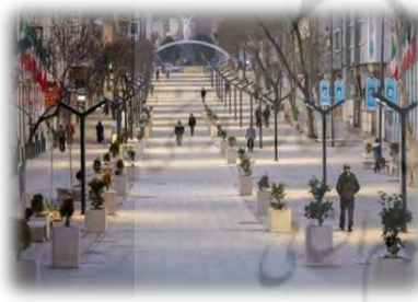
شکل (۴) پیاده‌روی پارک آبیتر سنندج

محلات قدیمی سنندج بیانگر این است که این بافت فرهنگ مردم را تقویت می‌کند و مردم هویت خود را پیدا می‌کنند. در شهر سنندج مبلمان شهری، پارک‌ها، خیابان‌ها و فضاهای سبز بسیار کم می‌باشد که ضعف مدیریت شهری را نشان می‌دهد. شهرداری سنندج معاونت گردشگری ندارد. این موضوع باعث شده که شهر سنندج در مقایسه با سایر شهرهای کشور با کمبود امکانات رفاهی و فرهنگی مواجه شود. سنندج معروف به شهر مجسمه‌ها می‌باشد. به واسطه حضور مجسمه‌سازان هنرمند مانند مرحوم خلیلی فرد مورد توجه مسافران قرار گرفته و المان‌های خوبی به شهرداری داده است.