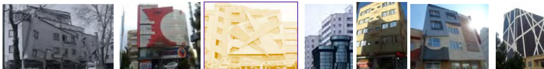
شکل ۲. نمونه‌هایی از ناسامانی‌های بصری در نمای ابنیه معاصر ایران

بررسی وضعیت نماهای ساختمان‌های امروزی در شهرهای ایران نشانگر ناسازگاری و ناهمگونی در نماها در انواع سبک‌های معماری، عدم یکپارچگی، انفجار شکلی، آشفتگی و بی‌هویتی و تضاد در طراحی نماها است. زبان طراحی نماها غیرقابل فهم شده و ناسامانی‌های بصری در نماهای ساختمان‌های معاصر ایرانی قابل مشاهده است. این نماهای آشفته و آزاردهنده، جز آلودگی بصری و پریشانی ذهنی، چیز دیگری را برای مخاطبان فراهم نمی‌آورند. استفاده از مصالح مختلف همچون شیشه و ورق‌های کامپوزیت و ایجاد سبک‌های کاذب هویت و فرهنگ شهری را به چالش کشیده و ناهنجاری‌هایی را سبب شده است. نماهایی کپی‌برداری شده فاقد هرگونه هویت واقعی و ارزش‌های فرهنگی در صحنه ساخت‌وساز به بازاری برای تظاهر تبدیل شده است. این وضعیت موجب ایجاد فرهنگ التقاط‌گرایانه‌ای شده که جلوه‌های فرهنگ اصیل ایرانی را هر روز بیش‌ازپیش کم‌رنگ و تاریک می‌کند (شکل ۲).