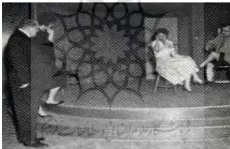
تصویر (۲). صحنه سایکودرام با حضور مورنو ۱۲

در روان‌نمایشگری، مدیر مسئول فرآیند گروهی و نیز افراد درگیر در این فرآیند است. او باید گروه را فعال کند (مرحله گرم کردن) و به آن‌ها کمک کند تا در مورد یک موضوع مشترک در پایان مرحله گرم کردن تصمیم‌گیری کنند. براساس قرارداد با گروه یا قهرمان، او فرضیه‌های تشخیصی را توسعه می‌دهد، اهداف فرآیند را تعریف می‌کند، بازی را ساختار بندی می‌کند، مرحله عمل را آغاز می‌کند و بازی را با کمک تکنیک‌های مختلف روان‌نمایشگری هدایت می‌کند، در حالی که اصول اساسی کار روان‌نمایشگری را رعایت می‌کند. مدیر، یک کارگردان، تحلیلگر و درمانگر است، که همه آن‌ها یک نفر هستند. در پایان، او مرحله عمل را تکمیل می‌کند و مرحله ادغام را با به اشتراک گذاری، بازخورد نقش و تجزیه و تحلیل فرآیند، در هماهنگی با قهرمان یا گروه تعدیل می‌کند. مدیر باید نزدیک به شخصیت اصلی باشد، به خصوص در موقعیت‌های احساسی از سوی دیگر، او باید مراقب باشد که خود را در پویایی عاطفی وقایع روی صحنه از دست ندهد. وظیفه مدیر در روان‌نمایشگری بسیار پیچیده و دشوار است (Ameln & Becker-ebel, 2020: 19). تصویر (۲)