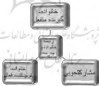
نمودار ۴: مدل مفهومی رابطه احتمالی خانواده و مدرسه

در یک نگاه تقابلی-ارتباطی، نقش‌های رابطه خانواده و مدرسه را نسبت به هم می‌توان در مدل مفهومی زیر ساده‌سازی کرد (نمودار شماره ۴).