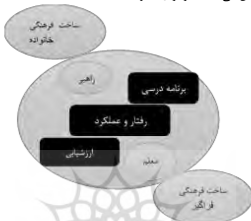
نمودار ۶: رابطه عناصر مدرسه با خانواده در پارادایم رفتارگرایی

مانند خانواده بسته است. طبق نمودار ۶، ساختار فرهنگی (فراگیر و خانواده) به عنوان امری فرامدرسه‌ای و بیرون از عوامل درون مدرسه‌ای (دایره بزرگ نمودار) قرار داشته و مدرسه مستقل عمل می‌کند. در اینجا مدرسه بدون توجه به نقش و جایگاه خانواده تصمیم‌سازی و تصمیم‌گیری می‌کند و هیچ توجهی به ساخت فرهنگی خانواده و دانش‌آموز ندارد. در چنین حالتی خانواده به عنوان «گیرنده منفعل ۲۱» مفهوم‌سازی می‌شود. در این حالت می‌توان گفت آنچه رابطه مدرسه و خانواده را تعیین می‌کند، «کار برای خانواده» است.