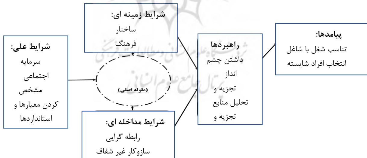
(شکل ۲): مدل پارادایمی پژوهش