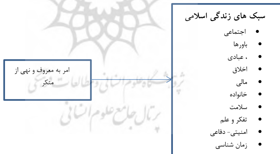
شکل ۱: چارچوب مفهومی پژوهش (محقق ساخته)