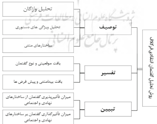
شکل ۱: نمودار روش تحلیل گفتمان انتقادی فرکلاف

است. نظریه گفتمان، پس از حدود دو دهه از زبان‌شناسی، به تحلیل‌های انتقادی در حوزه مسائل اجتماعی، سیاسی و فرهنگی راه یافت. رویکرد انتقادی بر این ادعا استوار است که ناگفته‌ها یا گزاره‌های تلویحی، دارای منشأ ایدئولوژیک هستند که در گفتمان یافت شده و در تعیین جایگاه افراد به عنوان کنشگران اجتماعی نقش ایفا می‌کنند. نظم گفتمانی، مفروضاتی را در مورد روابط اجتماعی در بر دارد که اساس کنش‌های متقابل را تشکیل می‌دهند (حقیقت، ۱۳۹۴: ۵۴۱). در واقع، تحلیل گفتمان انتقادی، نسخه توسعه‌یافته‌تری از تحلیل گفتمان است که بر ارتباط و نسبت زبان و رویدادهای اجتماعی مانند سیاست‌گذاری تمرکز دارد. تحلیل گفتمان انتقادی، گفتمان را به عنوان نمودی از کردار اجتماعی در نظر گرفته و بر این مسئله تأکید دارد که تمامی ابزارها و کاربردهای زبانی، موقعیت‌های ایدئولوژیک را رمزگذاری می‌کنند (Shahiditabar, 2017:234). هدف از تحلیل انتقادی یک گفتمان، کشف ارتباط میان زبان، ایدئولوژی و قدرت و نشان دادن باورها و ارزش‌های ایدئولوژیکی است که به صورت طبیعی جلوه یافته‌اند (مظفری، ۱۳۹۶: ۷۹). نورمن فرکلاف، تحلیل گفتمان را توسعه یک چارچوب تحلیلی برای مطالعه زبان در رابطه با قدرت و ایدئولوژی می‌داند. رویکرد تحلیل گفتمان انتقادی، سیر تکوینی از تحلیل گفتمان در مطالعات زبان‌شناختی است که تحلیل گفتمان را از سطح بافت موقعیت فرد به سطح کلان یعنی جامعه، تاریخ و ایدئولوژی گسترش داده است (کلانتری، ۱۳۸۸: ۸).