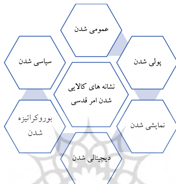
شکل ۱. نشانه‌های کالایی شدن امر قدسی