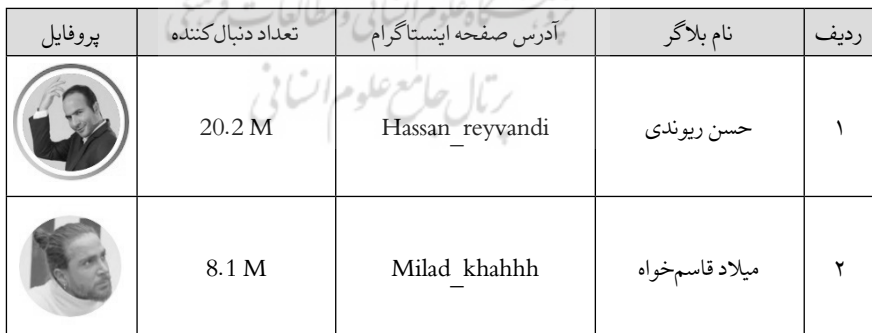
جدول ۱. لیست واینرهای ایرانی اینستاگرام (نمونه مورد مطالعه پژوهش)

جامعه آماری تحقیق حاضر واینرها یا بلاگرهای ایرانی فعال در شبکه اجتماعی اینستاگرام بوده و نمونه آماری پژوهش تعداد ۲۰ صفحه فعال دارای مخاطب بالای ۲ میلیون است. واحد معنا یا همان واحد تحلیل ۲ در این پژوهش، کلیپ‌های منتشر شده در صفحات بلاگرها است. صفحات انتخاب شده بلاگرهای ایرانی به عنوان نمونه آماری پژوهش حاضر عبارت‌اند از: