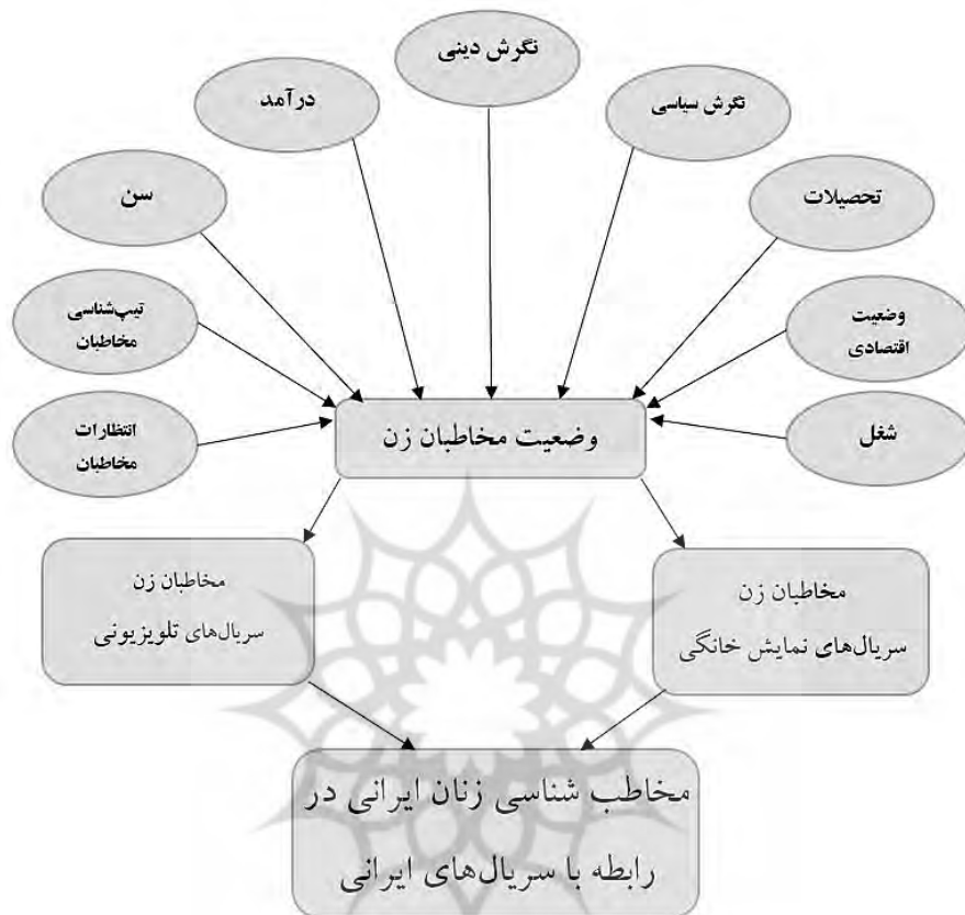
شکل (۱): مدل مطالعه کمی مخاطب شناسی زنان ایرانی در رابطه با مجموعه‌های تلویزیونی و مجموعه‌های ایرانی نمایش خانگی

یافته‌های پژوهش نشان داد که تأثیر متغیرهای جمعیت‌شناختی بر انتخاب و رضایتمندی مخاطبان در تلویزیون و شبکه نمایش خانگی یکسان نیست و هرکدام از این رسانه‌ها جامعه مخاطب ویژه خود را دارند. این تفاوت صرفاً ناشی از سلیقه نیست بلکه ریشه در شکاف‌های ساختاری، اقتصادی و فرهنگی جامعه دارد. در تلویزیون، سن و تحصیلات زنان نقشی کلیدی در میزان استفاده و رضایتمندی دارند و نشان می‌دهد رسانه ملی هنوز نتوانسته انتظارات زنان تحصیل کرده را برآورده سازد؛ درحالی‌که زنان مسن‌تر و با تحصیلات کم‌تر، تلویزیون را رسانه‌ای مشروع، در دسترس و همسو با