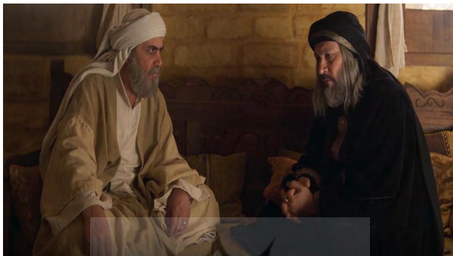
تصویر (۳): صحنه مذاکره ابوموسی اشعری و عمروعاص