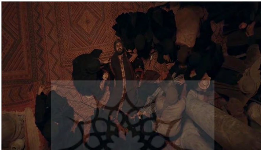
تصویر (۴): صحنه ترور معاویه توسط خوارج

حساسیت‌های مذهبی و غیره. ولی در هر صورت به‌وضوح می‌توان دریافت که انتخاب این روش نشان‌دهنده رویکرد آگاهانه کارگردان به روایت داستان و مدیریت عناصر مختلف فیلم‌سازی است.