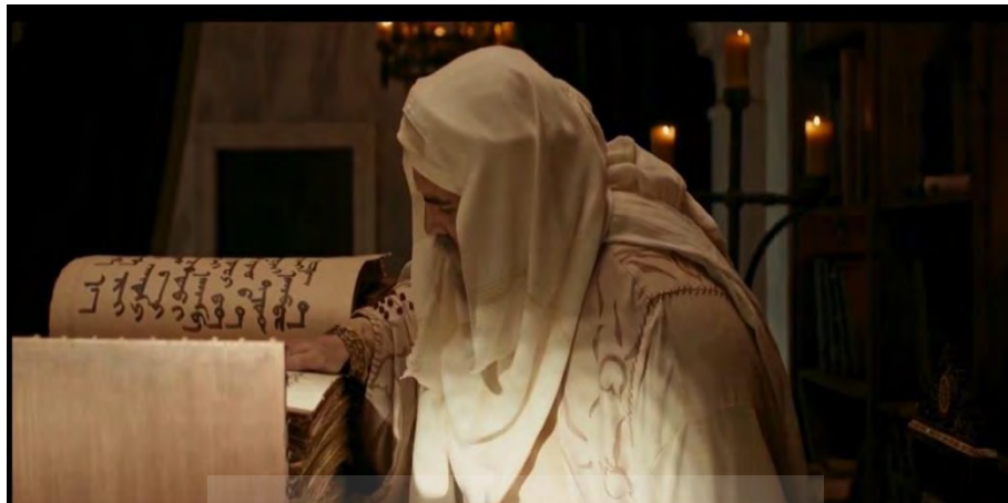
تصویر (۱): صحنه فوت معاویه هنگام قرائت قرآن

≠ ترتیب خطی: بخش‌هایی از روایت به صورت خطی و بر اساس توالی طبیعی زمان پیش می‌رود تا انسجام و وضوح داستان حفظ شود؛ برای مثال، در قسمت‌های چهارم تا سیزدهم، جنگ صفین از آغاز تا حکمیت به ترتیب زمانی روایت می‌شود. همچنین، در قسمت‌های هفدهم تا بیستم، اداره خلافت و مقابله با خوارج به صورت خطی ارائه می‌گردد که اقتدار و پیشرفت معاویه را به نمایش می‌گذارد. این ساختار خطی، به دنبال این است که حس تداوم و موفقیت تدریجی معاویه را به مخاطب منتقل کند.