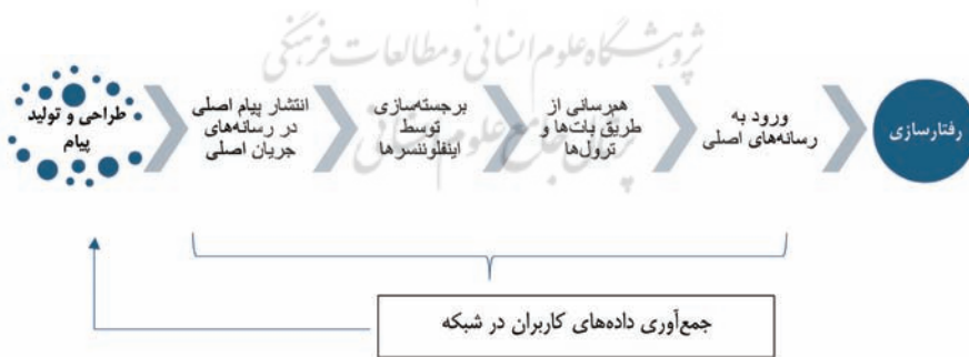
شکل ۱- مدل پیشنهادی

در ساحت محتوایی، ربات‌های فعال در شبکه‌های اجتماعی در کمپین‌های موثر شرکت می‌کنند. یک نوع معمول از کمپین‌ها که به منظور تبلیغات شخصی، بی‌اعتبار کردن مخالفان و تبلیغ برخی موضوعات و تبلیغات استفاده می‌شود چندین مرحله دارد. این کار معمولاً با انتشار پیام اصلی تحت پوشش یک گزارش در برخی رسانه‌های آنلاین به عنوان نقطه ورود به کارزار آغاز می‌شود. پس از آن به کمک اینفلوئنسرهایی که دنبال‌کنندگان زیادی در رسانه‌های اجتماعی دارند برجسته و در ادامه از طریق حساب‌های دستی یا خودکار جعلی تقویت و هم‌رسانی می‌شود. بعد از برجسته‌شدن در رسانه‌های اجتماعی هم معمولاً موضوع به خروجی رسانه‌های اصلی از جمله تلویزیون راه پیدا می‌کند. بنابر این می‌توان نتیجه گرفت ربات‌ها و حساب‌های جعلی بخشی از شبکه وسیع‌تری از ابزارهای رسانه‌ای هستند که توسط بازیگران سیاسی به کار گرفته می‌شوند.