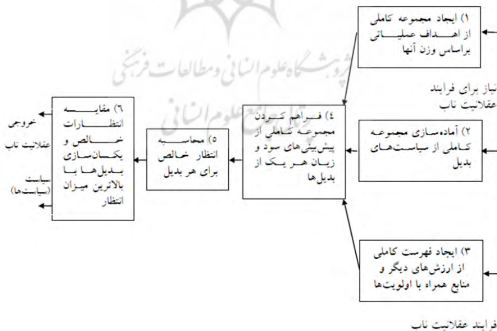
شکل ۱. نظام تصمیم‌سازی عقلانیت در شکل‌دهی سیاسی (تامس دای، ۱۳۸۷: ۵۸).

- مفهوم عقلانیت: عقلانیت به توانایی و استعداد انسان برای