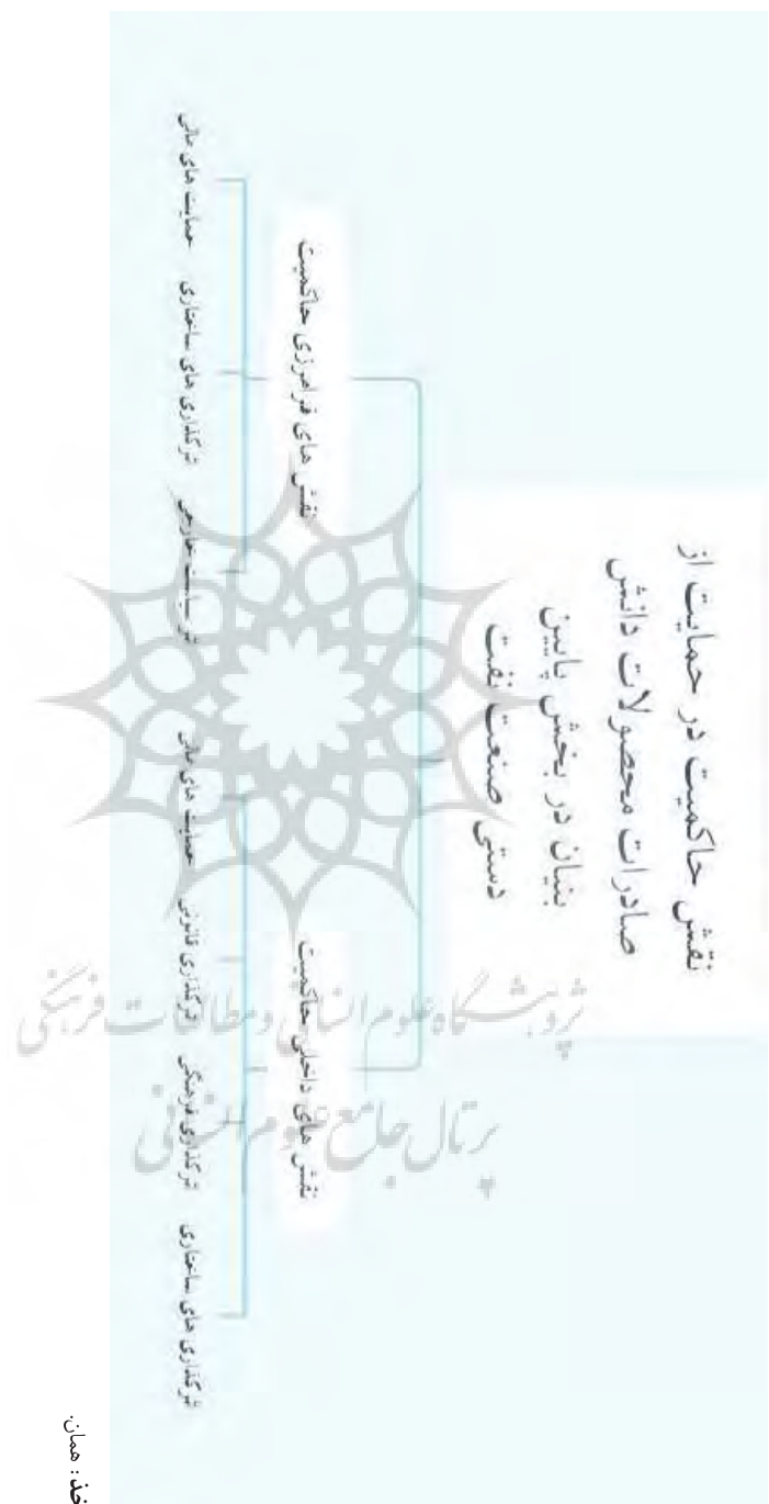
شکل ۳- نقش حاکمیت در صادرات محصولات دانش بنیان