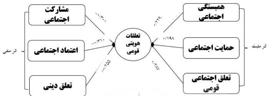
شکل ۳. رابطه مؤلفه‌های سرمایه اجتماعی و تعلقات هویت قومی