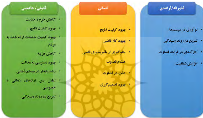
شکل ۲. طبقه‌بندی مزایای هوش مصنوعی در نظام قضایی