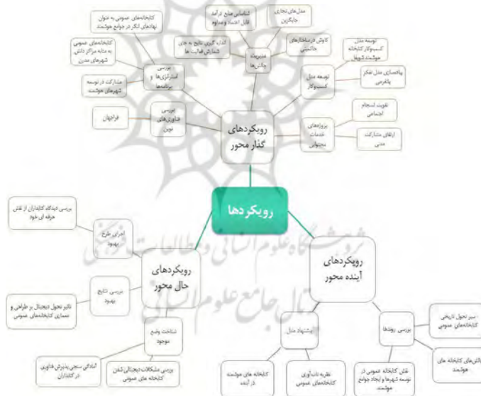
شکل ۲. رویکردهای پژوهشی تحول دیجیتال کتابخانه‌های عمومی

مجموعه سه رویکرد شناسایی شده و تحلیل‌های پیرامونی آن‌ها به صورت یکپارچه و مصور در شکل ۲، نمایش داده شده است.