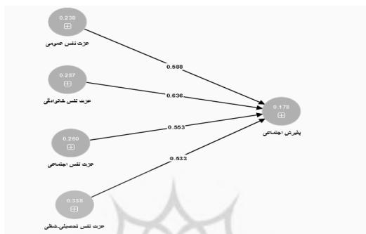
شکل ۱. مدل تعیین رابطه بین متغیر عزت‌نفس و ابعاد آن با پذیرش اجتماعی

نتایج نشان می‌دهد که اثر مستقیم مثبت بین عزت‌نفس و پذیرش اجتماعی برقرار است.