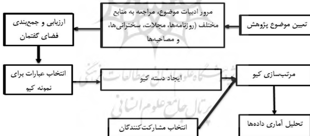
شکل ۱- مراحل روش تحقیق کیو

روش کیو به‌عنوان پیوندی میان روش‌های کمی و کیفی، امکان تحلیل عمیق ذهنیت‌ها را فراهم می‌کند و برخلاف روش‌های معمول که متغیرها تحلیل می‌شوند، در این روش افراد و الگوهای فکری آن‌ها مورد بررسی قرار می‌گیرند. نمونه‌گیری در این روش هدفمند و بر اساس ارتباط مستقیم افراد با موضوع تحقیق انجام می‌شود و معمولاً حجم نمونه کوچک است ولی از نظر کیفیت داده‌ها بسیار غنی است. این رویکرد تحقیقاتی، به‌ویژه در مطالعات سیاسی و اجتماعی که تحلیل دیدگاه‌های پیچیده و چندوجهی نخبگان اهمیت دارد، کاربرد گسترده‌ای دارد و می‌تواند به کشف الگوهای فکری و نگرش‌های پنهان نسبت به موضوعات کلان مانند فدرالیسم و ژئوپلیتیک کمک کند.