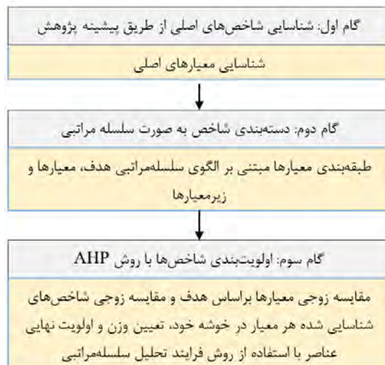
شکل ۱- فرایند اجرای تحقیق

جامعه مورد بررسی را خبرگان که مدیران و کارشناسان حوزه مدیریت دولتی شامل ۱۶ استاد دانشگاه و ۹ مدیر سازمان‌های دولتی تشکیل می‌دهند. نمونه‌گیری به صورت هدفمند غیر تصادفی با روش گلوله‌برفی انجام شده‌است.