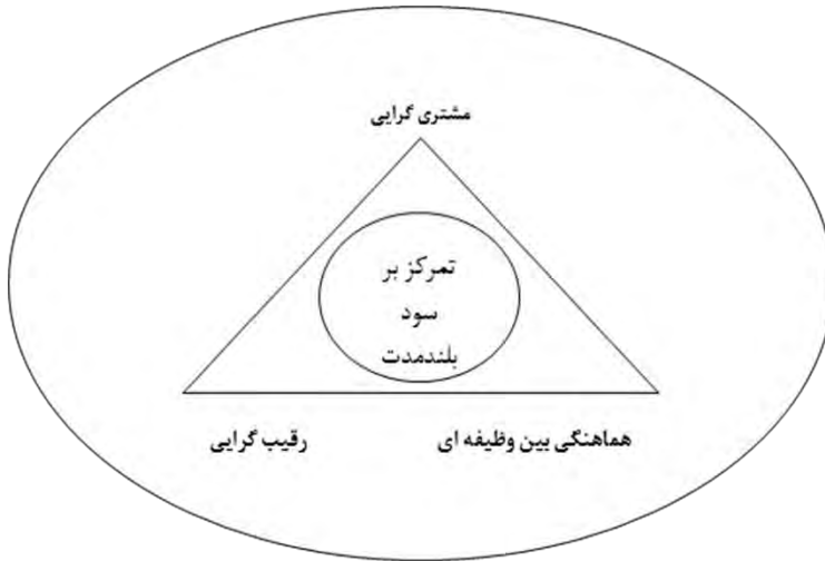
شکل ۱. بازارگرایی، (نارور و اسلاتر، ۱۹۹۰).

مشتری گرایی نیازمند شناخت کافی سازمان از مشتری برای ایجاد ارزش برتر (محصول و خدمات برتر) برای آنان است.