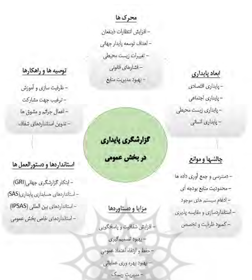
شکل ۳. مدل مفهومی گزارشگری پایداری در بخش عمومی - (منبع: یافته های پژوهشگران)