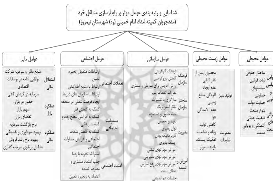
شکل ۱: مدل مفهومی عوامل مؤثر بر پایداری مشاغل خرد

در ابتدا به روش مصاحبه معیارها و زیرمعیارها شناسایی می‌گردد، سپس با استفاده از نرم‌افزار MAX QDA، تحلیل تم و طراحی مدل صورت می‌پذیرد و معیارها و زیر معیارهای شناسایی شده در بخش کیفی، جهت راست آزمایی و رتبه‌بندی از تحلیل عاملی تأییدی و مدل معادلات ساختاری، در نرم‌افزار PLS استفاده می‌شود. جامعه آماری بخش کیفی پژوهش شامل اساتید، کارشناسان و خبرگان حوزه مربوطه می‌باشد و جامعه آماری بخش کمی پژوهش کلیه مددجویان کمیته امام خمینی (ره) شهرستان نیمروز استان سیستان و بلوچستان هستند تشکیل می‌دهد که در بخش کارآفرینی و کسب‌وکار، فعال می‌باشند و در بازه سنی ۲۰ تا ۵۰ سال قرار دارند. طبق آمار گزارش شده ۱۷۱۳۰۰ نفر می‌باشند.