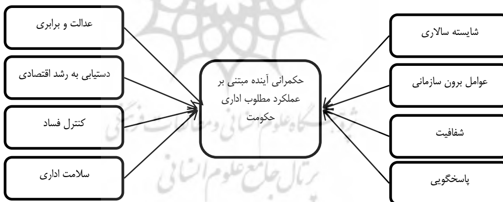
شکل ۲: مدل حکمرانی آینده مبتنی بر عملکرد مطلوب اداری حکومت با استفاده از رویکرد مرور نظام‌مند

مقالات در حوزه حکمرانی آینده مبتنی بر عملکرد مطلوب اداری حکومت در ایران مورد بررسی قرار گرفته‌اند، نتایج با استفاده از رویکرد مرور نظام‌مند ادبیات علمی حاکی از شناسایی ۸ بعد شایسته‌سالاری، عوامل برون-سازمانی، شفافیت، پاسخگویی، عدالت و برابری، دستیابی به رشد اقتصادی، کنترل فساد و سلامت اداری و ۴۱ مولفه است. بنابراین با این یافته‌ها مدل حکمرانی آینده مبتنی بر عملکرد مطلوب اداری حکومت در ایران با استفاده از رویکرد نظام‌مند ادبیات علمی در شکل (۲) طراحی شده است.