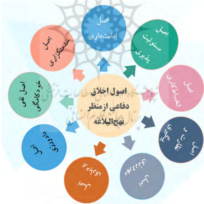
شکل شماره ۱- اصول اخلاق دفاعی در نهج‌البلاغه

در ادامه برای استخراج اصول اخلاق دفاعی از کدگذاری‌های داده بنیاد استفاده گردیده است؛ بدین صورت که با متن خوانی مبانی نظری و انتخاب گزاره‌های اصول اخلاق دفاعی، ابتدا با توجه به برخی از فرازهای نهج‌البلاغه، ۲۹۷ مفاهیم اولیه کدگذاری و درگام بعدی با تلفیق و دسته‌بندی مفاهیم هم‌سنخ و با استفاده از کدگذاری محوری، تعداد ۶۳ مفهوم کلی‌تر در قالب مفاهیم اصلی رهنامه استخراج و نهایتاً با کدگذاری انتخابی و از طریق چندین مرحله به صورت رفت و برگشت با اخذ نظر خبرگان مرتبط با موضوع تعداد ۹ اصل اخلاق دفاعی در شکل شماره ۱ احصاء گردید: