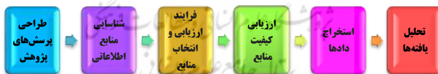
شکل 1. گام‌های مرور سیستماتیک با رویکرد فراترکیب (کیتچنهام، 2004)

این پژوهش مبتنی بر مراحل مرور سیستماتیک انجام شده و در مرحله تحلیل و ترکیب یافته‌ها از رویکرد فراترکیب استفاده شده است. مرور سیستماتیک با تعریف یک پروتکل مرور آغاز می‌شود. با توجه به قلمرو موضوعی و اینکه فقط مرور سیستماتیک ادبیات مدنظر است، در این مقاله، برای دستیابی به هدف پژوهش از فرایندی استفاده می‌شود که (کیتچنهام 4 ، 2004) ارائه کرده است که خلاصه مراحل آن در شکل 1 مشاهده می‌شود.