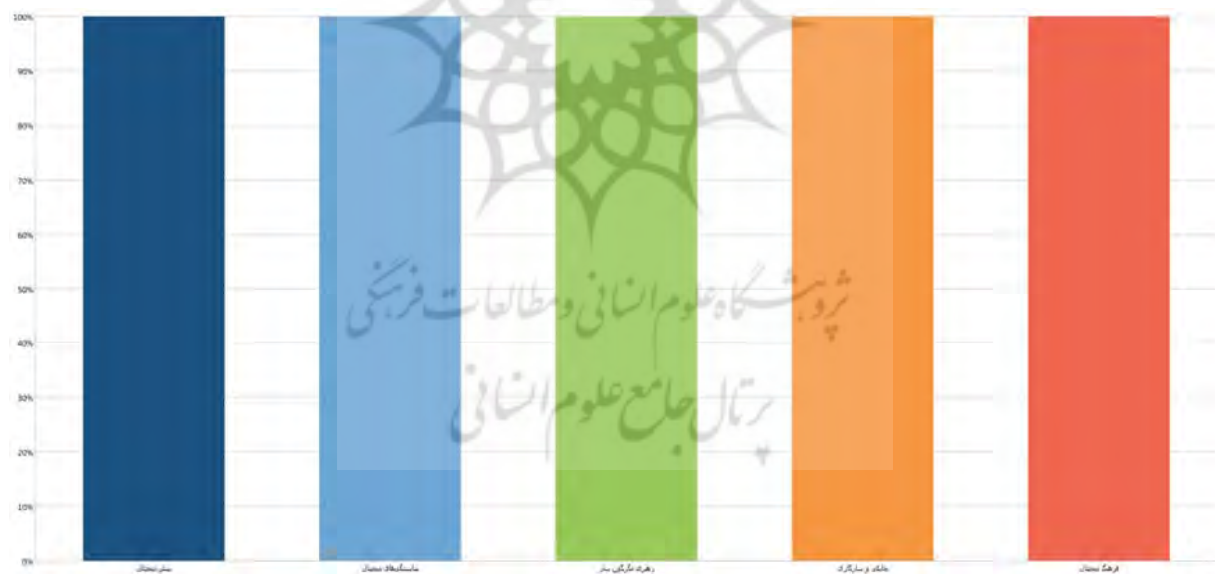
نمودار ۱: نمودار اشباع نظری مصاحبه‌ها برای ابعاد مدل