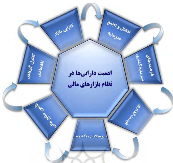
شکل ۱: اهمیت دارایی‌های در نظام بازارهای مالی