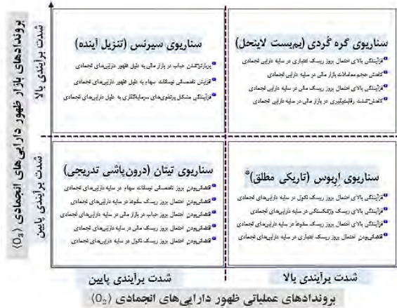
شکل ۷: سناریوهای محتمل بروندادهای ظهور دارایی‌های انجمادی

شکل (۸) هر ۴ سناریوی تعریف شده براساس محورهای عمودی و افقی را نشان می‌دهد و جدول (۱۲) نیز به تفکیک هر سناریو اقدام به ارائه جزئیات مضامین قرار گرفته در آن نموده است.