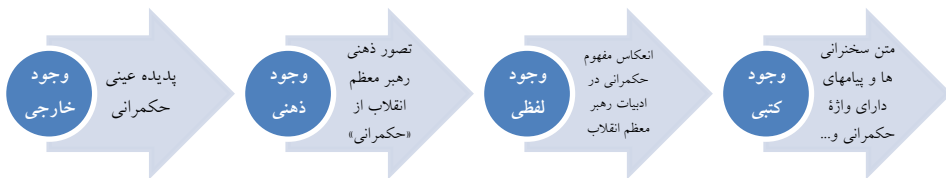
شکل ۱. فرایند اشراب اجزای مفهوم حکمرانی در سخنرانی‌ها و پیام‌های رهبر انقلاب

از آنجاکه بر اساس مبانی نظری پژوهش، گفتارها و نوشتارهای رهبر معظم انقلاب درباره حکمرانی بر پایه تصویری ذهنی از حکمرانی بوده و ایشان در قالب الفاظ، قصد انتقال آن مفهوم را داشته است (شکل شماره ۱)، پس از «شناسایی سخنرانی‌ها و پیام‌های دارای دلالت قابل استفاده به منظور کشف اجزای عقلی مفهوم حکمرانی» (شکل شماره ۲)، فرایند پژوهش ترسیم و اجرا شد.