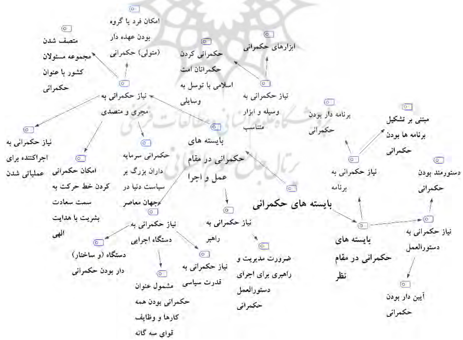
شکل ۶. نقشه مضمون فراگیر «بایسته‌های حکمرانی» (منبع: محقق ساخته)