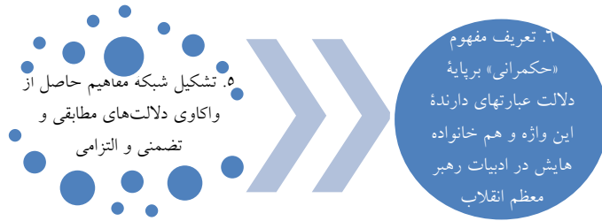
شکل ۴. فرایند تنظیم مفهوم حکمرانی برآمده از ادبیات رهبر انقلاب و ارائه تعریف حکمرانی