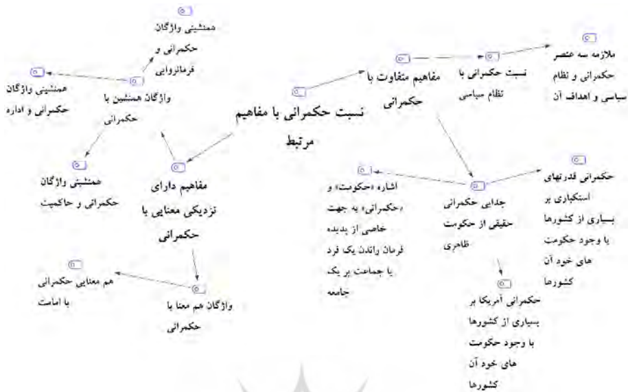
شکل ۷. نقشه مضمون فراگیر «نسبت حکمرانی با مفاهیم مرتبط»

از آنجا که شبکه‌های مضامین، ابزاری برای تحلیل هستند، نه خود تحلیل (شیخ‌زاده و دیگران، ۱۳۹۰: ۱۸۲)، پس از ترسیم شبکه‌های مضامین، نوبت به تحلیل این شبکه‌ها در گام پنجم فرایند این پژوهش رسید. به این منظور، نخست باید پس از نهایی‌سازی مضمون‌های ترسیم‌شده در این شبکه‌ها، آن‌ها را تعریف کرد (اقدام شماره ۱۵). بر این اساس، «کارکردهای حکمرانی»، اهداف و دستاوردهایی است که هر حکمرانی، برای تحقق آنها طراحی و اجرا می‌شود و «بایسته‌های حکمرانی»، نیازمندی‌های هر حکمرانی برای تحقق و موفقیت است. پس از تعریف، شبکه هر یک از این مضمون‌های فراگیر، نیازمند «توصیف و توضیح» است (اقدام شماره ۱۶).