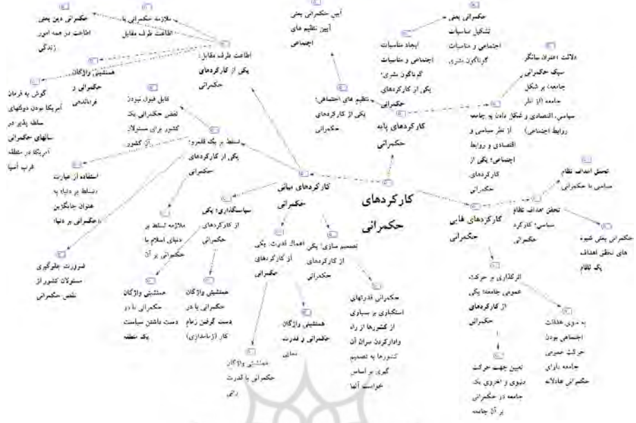
شکل ۵. نقشه مضمون فراگیر «کارکردهای حکمرانی»