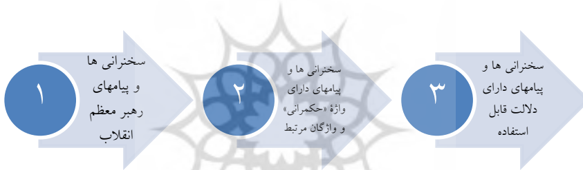
شکل ۲. فرایند شناسایی سخنرانی‌ها و پیام‌های دارای دلالت قابل استفاده