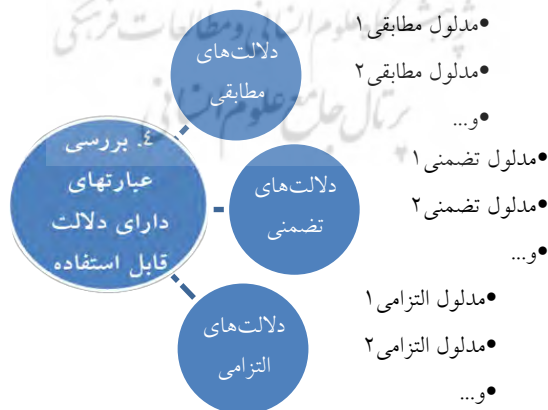
شکل ۳. فرایند تحلیل عبارتهای دارای دلالت قابل استفاده