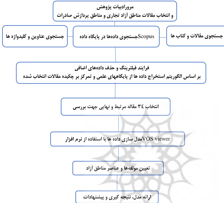
شکل ۱- الگوریتم روش شناسی پژوهش پژوهشگاه علوم انسانی و مطالعات فرهنگی رتال جامع علوم انسانی

پس از آن، ۱۷ مقاله دیگر از مرتبطترین مراجع جمع‌آوری و در نهایت، این فرایند با انتخاب ۳۴ مقاله به پایان رسید. خلاصه متدولوژی تحقیق در شکل ۱ نشان داده شده است.