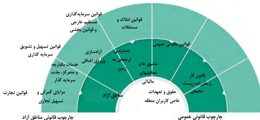
شکل ۵- عناصر اصلی چارچوب قانونی