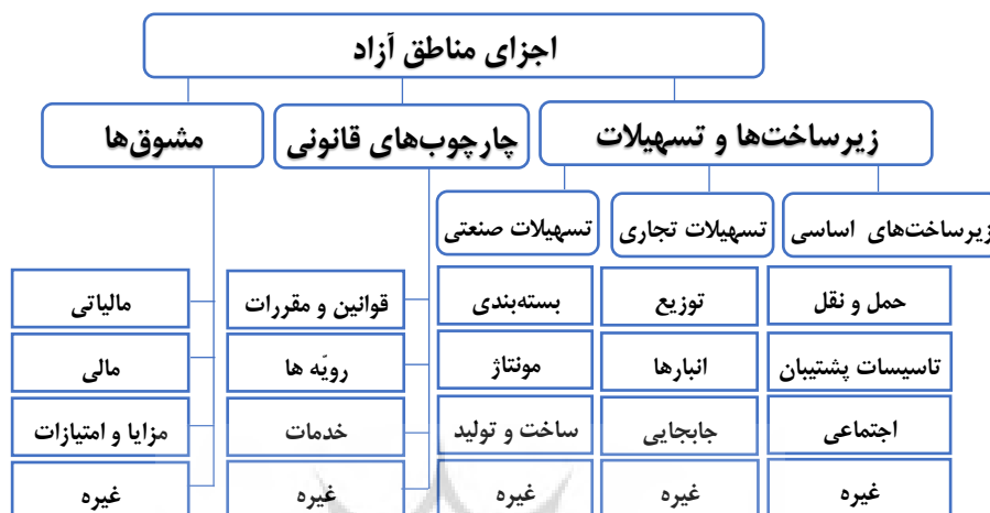
شکل ۴- مدل ارزیابی و بهبود عملکرد مناطق آزاد

در این راستا، مطالعه حاضر اجزای مناطق آزاد، از جمله چارچوب قانونی، مشوق‌ها و زیرساخت‌ها را مطابق شکل ۴ شناسایی، جمع‌بندی و در قالب مدل ارزیابی و بهبود عملکرد مناطق آزاد ارائه نموده است.