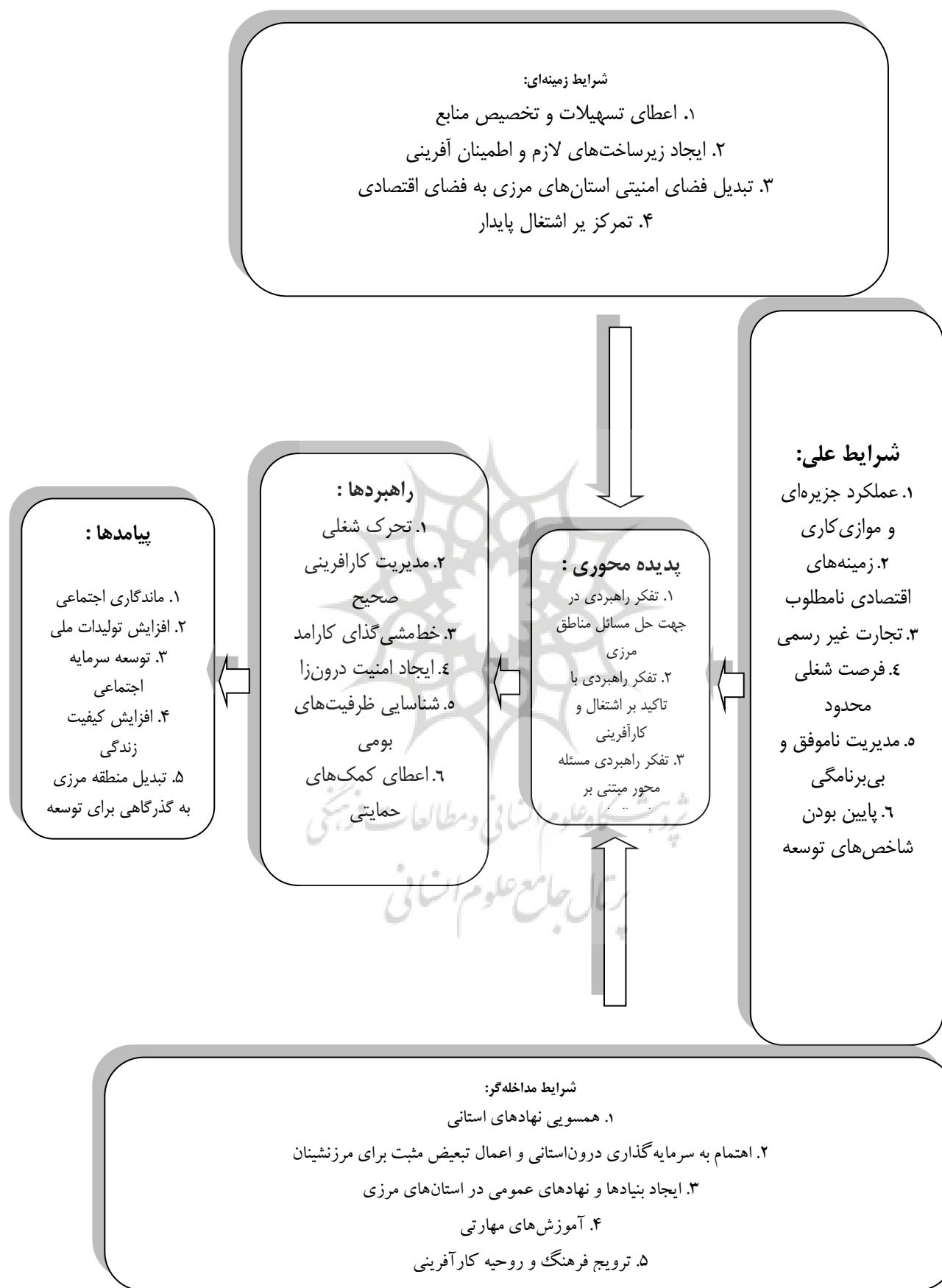
شکل ۱. نظام حل مسائل مناطق مرزی با تأکید بر کارآفرینی و اشتغال