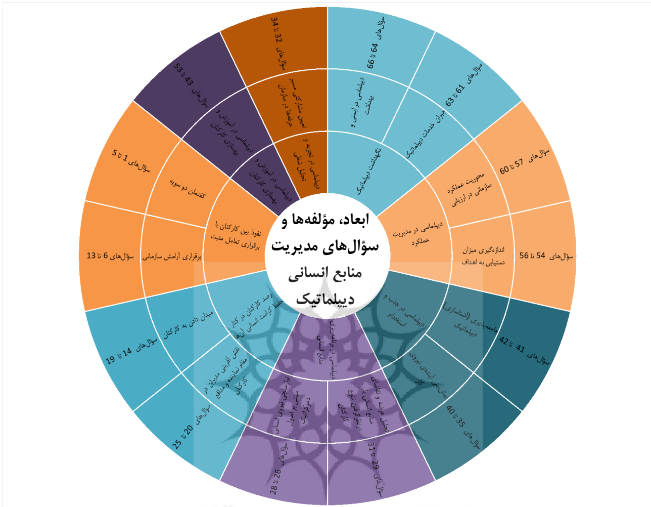
شکل ۱. ابعاد، مؤلفه‌ها و سؤال‌های مدیریت منابع انسانی دیپلماتیک

پرسشنامه‌های خوب طراحی شده و معتبر می‌توانند داده‌هایی غنی از سازه و مفهوم مورد اندازه‌گیری در اختیار افراد قرار دهند و کیفیت و اعتبار تصمیم‌گیری‌ها را افزایش دهند (سینودینوس ۱ ، ۲۰۰۳).