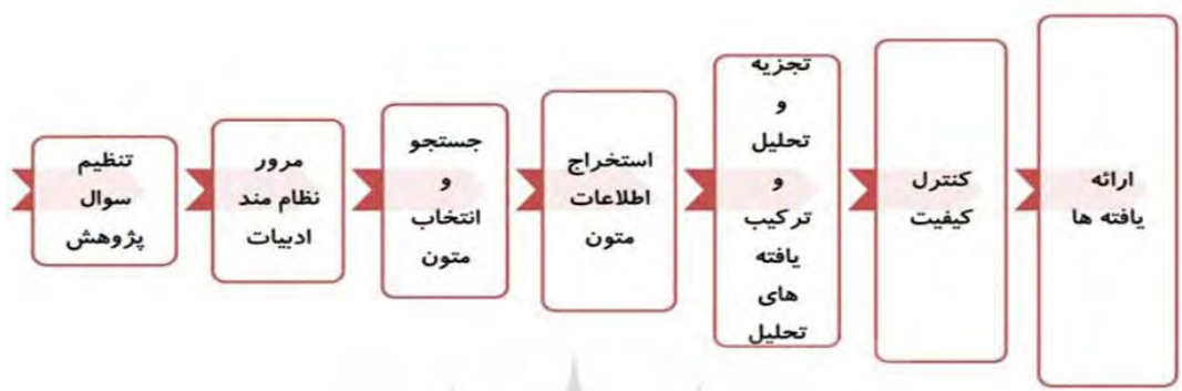
شکل (۱): مراحل فرایند فراترکیب سندلوسکی و باروسو (۲۰۰۷)

از آنجا که هدف این پژوهش شناسایی تاثیرات بازاریابی دنج در شرکت های تجاری است و پژوهش های بسیار غنی در این حیطه صورت گرفته این پژوهش با استفاده از روش کیفی و رویکرد فراترکیب انجام خواهد شد. فراترکیب برای یکپارچه سازی چندین مطالعه و ایجاد یافته های جامع و تفسیری صورت می گیرد و متمرکز بر مطالعات کیفی است و به ارتباط مطالعات کیفی با یکدیگر و فهم عمیق پژوهشگر برمیگردد تا بتواند تاثیرات بازاریابی دنج در شرکت های تجاری را شناسایی کند. روش فراترکیب، که یافته های چندین مطالعه را جمع آوری میکند، میتواند دیدگاهی جامع از پتانسیل و محدودیت های بازاریابی دنج ارائه دهد. در این پژوهش، از روش هفت مرحله ای فراترکیب سندلوسکی و باروسو (۲۰۰۷)، بهره میبریم، مراحل اصلی پژوهش شامل موارد زیر خواهد بود: