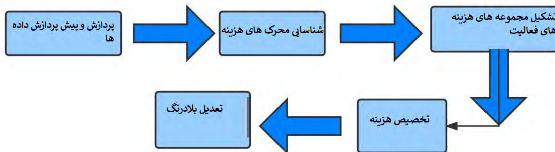
شکل (۱): نمودار جریان ABC مبتنی بر هوش مصنوعی