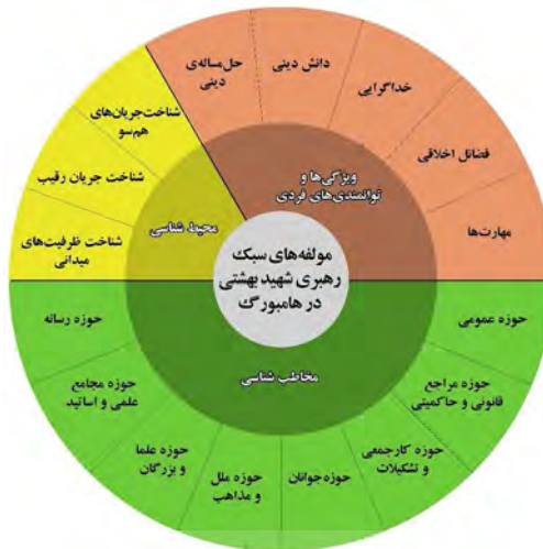
نمودار ۴. نمودار دایره‌ای مؤلفه‌های سبک رهبری شهید بهشتی در مرکز اسلامی هامبورگ