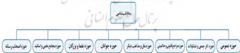
نمودار ۲. مضامین شکل‌دهنده به مؤلفه مخاطب‌شناسی

در کنار این دو حوزه اساسی شهید بهشتی از توجه به حوزه‌های دیگر مخاطبین بازمانده و وجود مضامین سازمان‌دهنده «حوزه رسانه»، «حوزه مجامع علمی و استادان»، «حوزه علما و بزرگان»، «حوزه ملل و مذاهب دیگر» و «حوزه مجامع قانونی و حاکمیتی» در یافته‌های پژوهش گویای همین معناست. در نمودار شماره ۲ جزئیات بیشتری از مضامین پایه و سازمان‌دهنده ذیل «مخاطب‌شناسی» قابل مشاهده است.