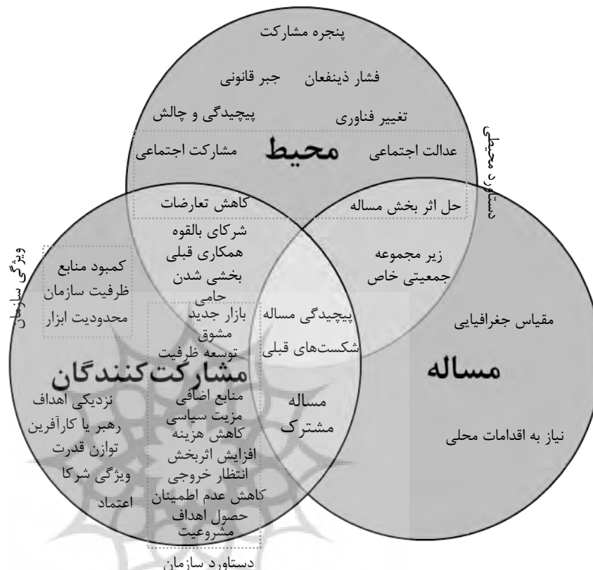
شکل شماره ۴: مدل همپوشانی پیشران‌های همکاری بین‌سازمانی

جدول شماره ۲ و ۳ خلاصه‌ی آماری از مقالات کدگذاری شده در نرم‌افزار است. مطابق با جدول شماره ۲ از ۲۶۸ مقاله اولیه، ۸۳ مقاله انتخاب و از این تعداد ۳۲ مقاله وارد فاز نهایی مطالعات شده و کدگذاری گردیدند. از ۳۲ مقاله، با توجه به ستون دوم جدول ۲، در ۳۰ مقاله، کدهای مربوط به دسته مشارکت‌کنندگان، در ۲۱ مقاله، کدهای مربوط به محیط و در ۶ مقاله، کدهای مربوط به ماهیت مساله استخراج گردید. ستون‌های سوم و چهارم این جدول به ترتیب درصد تعداد مقالات دارای آن کد نسبت به ۸۳ مقاله و درصد نسبت به ۳۲ مقاله را نمایش می‌دهند. به طور مثال در ۹۳/۷۵ درصد از ۳۲ مقاله کدگذاری شده، کدهای مربوط به مشارکت‌کنندگان وجود دارد. با توجه به جدول می‌توان گفت که اکثر مقالات مطالعه شده، پیشران‌هایی را در دسته مشارکت‌کنندگان ذکر نموده‌اند؛ بیش از