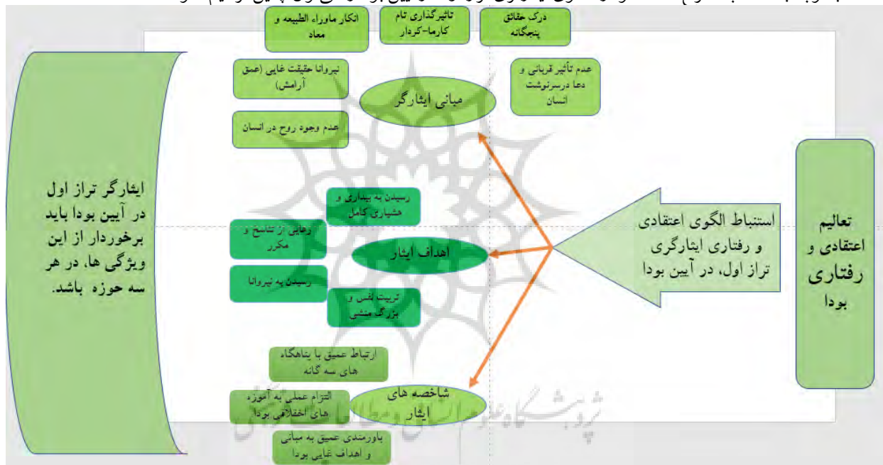
نمودار ۱: الگوی ایثارگری تراز اول در آیین بودا

با توجه به مطالب مطرح‌شده، نمودار الگوی ایثارگری تراز اول در آیین بودا را می‌توان چنین ترسیم نمود: