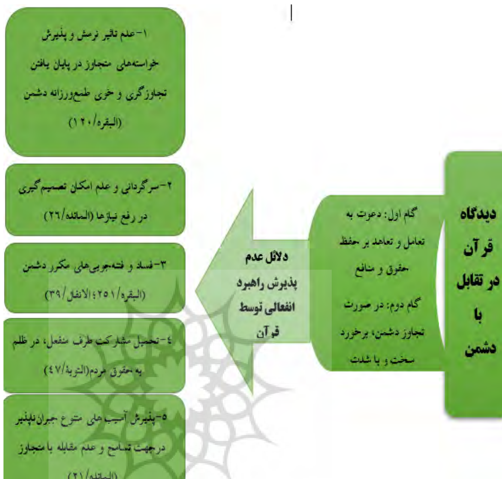
نمودار ۲: نقدهای راهبرد ایثار در آیین بودا

نمودار نقدهای وارد بر راهبرد ایثار در آیین بودا نیز به شرح زیر است: