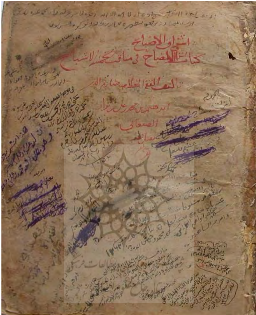
صفحة الغلاف للنسخة [ج]