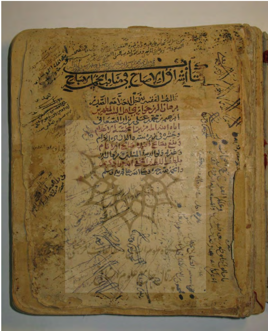
صفحة الغلاف من النسخة [أ]