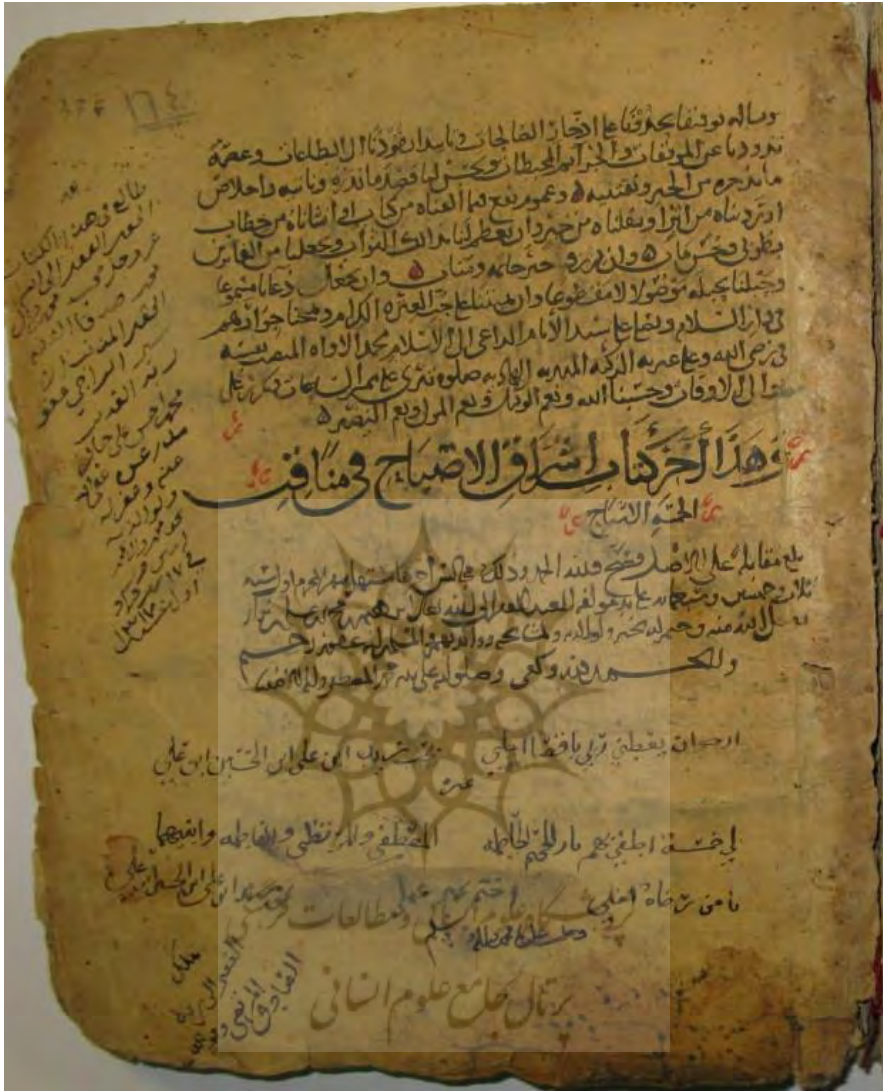
الصفحة الأخيرة من النسخة (أ)